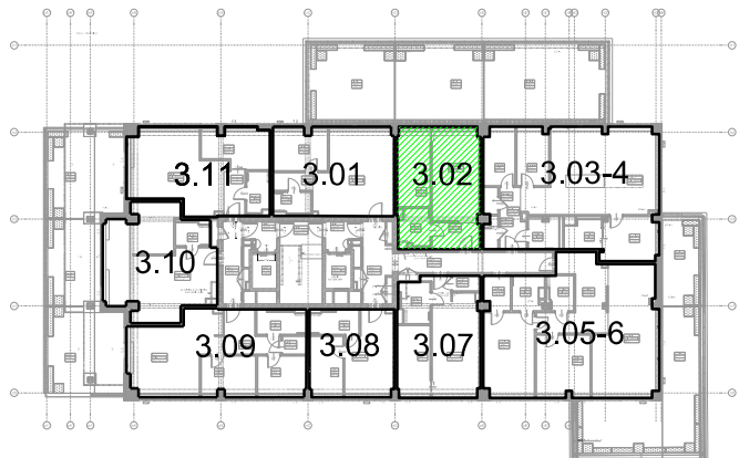
POŁOŻENIE LOKALU W BUDYNKU